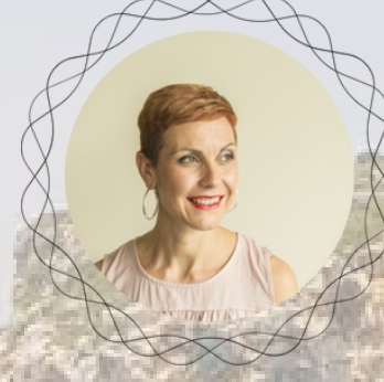
LOLA MEDICINA HOLÍSTICA REFLEXOTERAPIA FLORS DE BACH